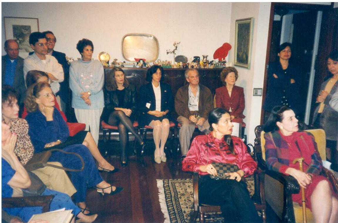
4. Reunião do Sabadoyle na Av. Epitácio Pessoa, 344, em 1993