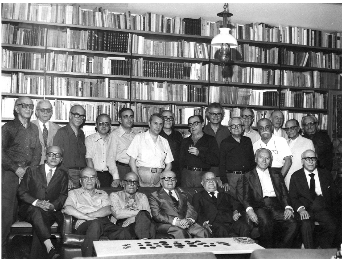
2. Reunião do Sabadoye na Rua Barão de Jaguaribe, 62, em 14 de julho de 1973