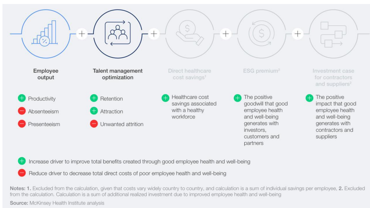
Figura 2 - Fatores de valor para desenvolver oportunidades de investimento na saúde e bem-estar dos funcionários.