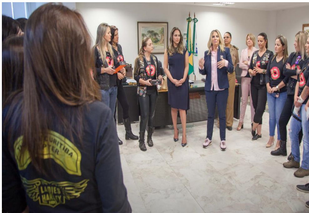
FIGURA 16: APRESENTAÇÃO DO OUTUBRO ROSA AO GOVERNO