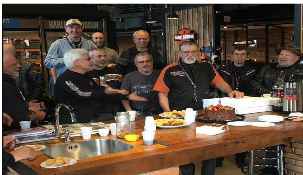
FIGURA 13: REUNIÃO DOS MEMBROS DO HDRG