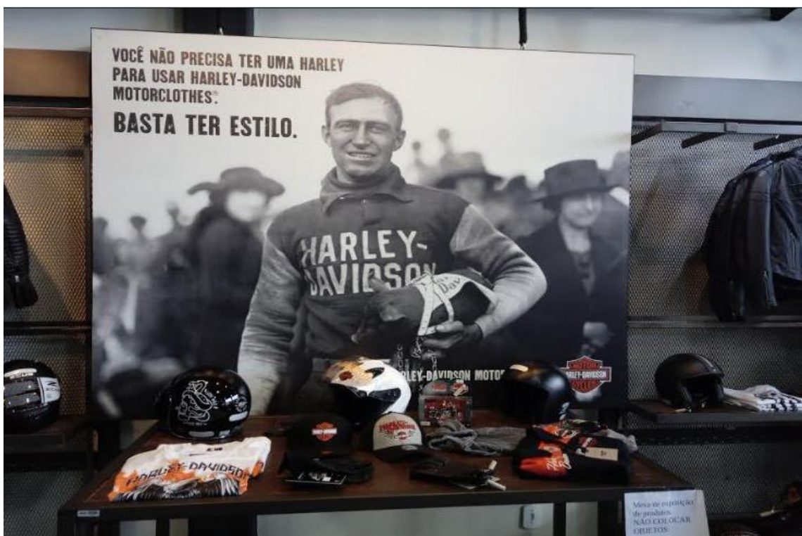
FIGURA 1: PEÇA PUBLICITÁRIA

motociclista segurando um porquinho] onde ambos vestem a marca Harley-Davidson . Acreditamos que a frase e a imagem estão sendo utilizadas, provavelmente, pelo fabricante de motocicletas Harley-Davidson para despertar o interesse daqueles que frequentam a concessionária à respeito da experiência grupal proporcionada pela marca. As roupas e os acessórios são alguns dos símbolos utilizados pelo grupo do HOG para mostrar que compartilham de uma mesma imagem grupal.