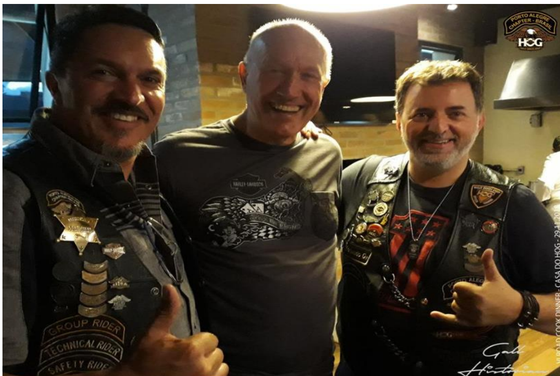
FIGURA 9: JANTAR DE CONFRATERNIZAÇÃO