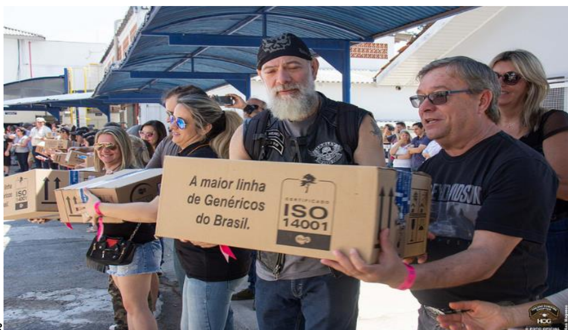
FIGURA 23: MEMBROS DO HOG E FAMILIARES DESCARREGANDO MEDICAMENTOS NO HOSPITAL ERASTO GAERTNER