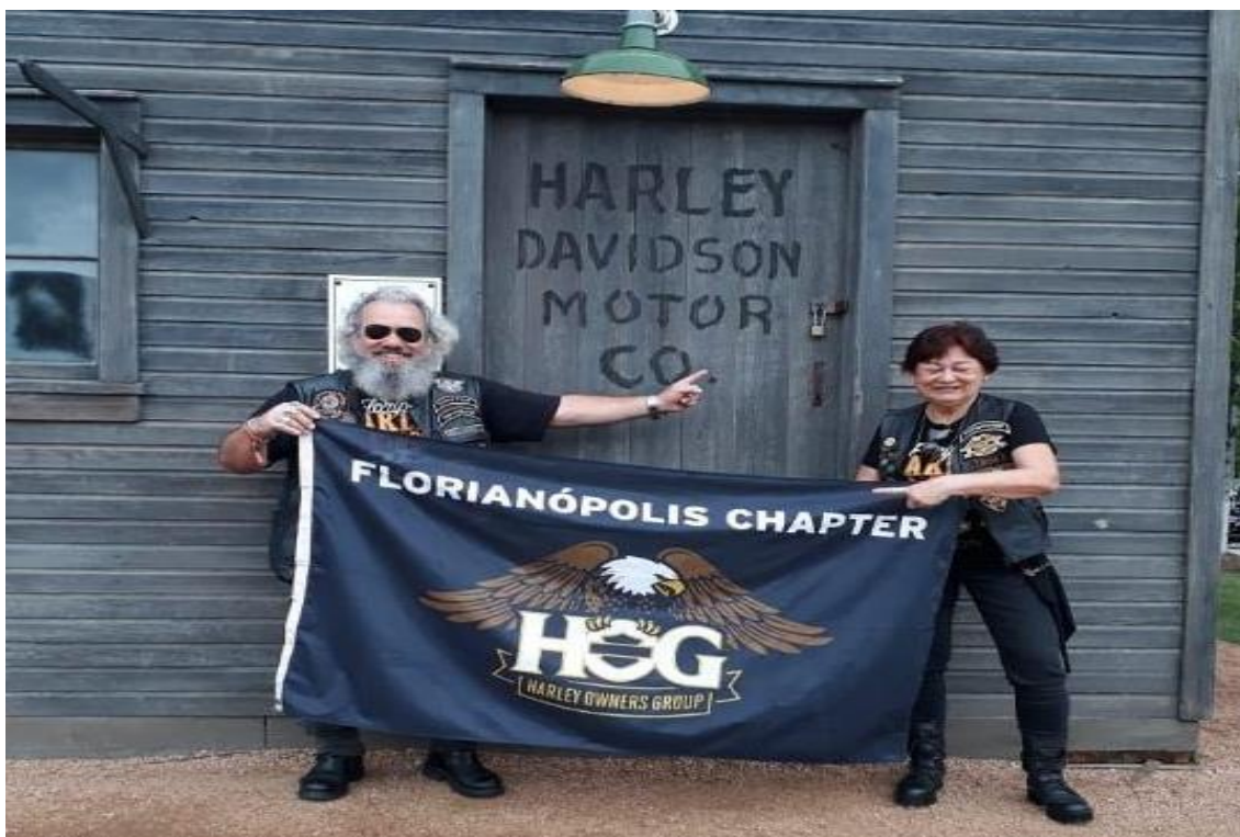
FIGURA 5: VISITA DO CASAL A PRIMEIRA FÁBRICA DE MOTO DA HD