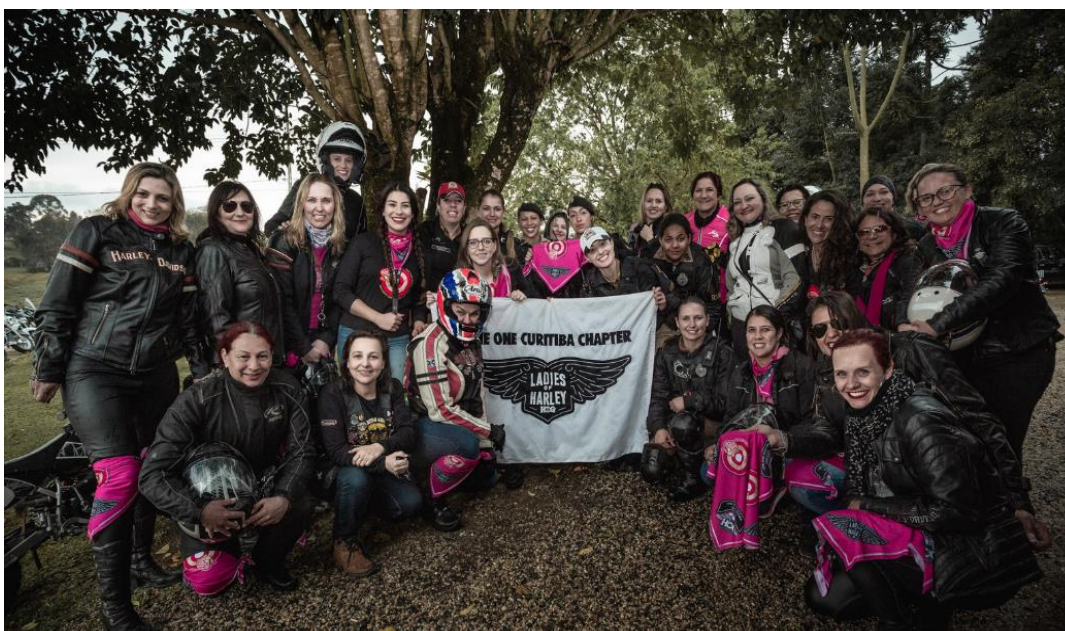
FIGURA 17: APRESENTAÇÃO DO OUTUBRO ROSA À POPULAÇÃO