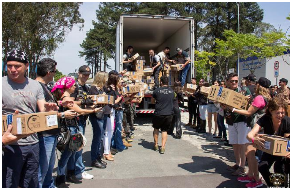
FIGURA 22: CORDÃO HUMANO CRIADO PARA DESCARREGAR MEDICAMENTOS NO HOSPITAL ERASTO GAERTNER