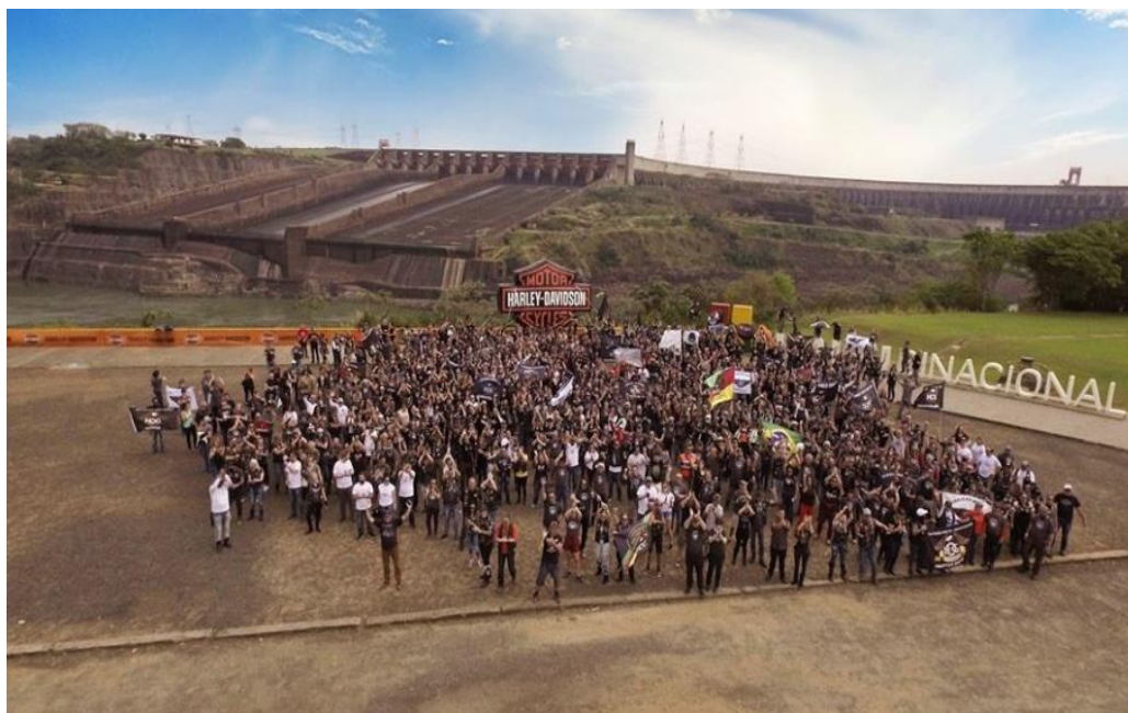
FIGURA 10: ENCONTRO DE HOGS DURANTE O CAMPEONATO HOG RALLY EM FOZ DO IGUAÇU, PR