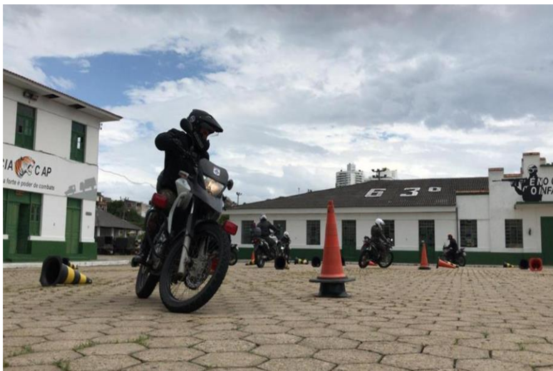
FIGURA 15: TREINAMENTO DE MANOBRAS DO HOG