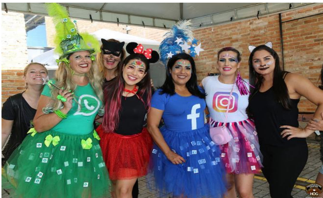
FIGURA 4: MULHERES MOTOCICLISTAS E VENDEDORAS DA HD