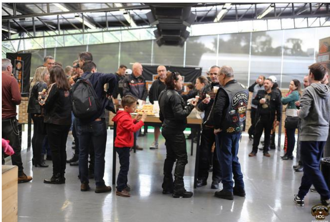
FIGURA 2: CAFÉ DA MANHÃ NA CONCESSIONÁRIA

A experiência no grupo torna um ou vários eventos emocionantes devido a possibilidade de ser vivenciada em família. Isso permite aos motociclistas se identificarem naqueles instantes como grupo, mas também identificarem membros da sua família como participantes, ou seja, ao incluir a família do HOG, o grupo se fortalece, quantitativa e qualitativamente, como família. Sendo exemplo dessa experiência (figura 2), a foto (tirada durante o café da manhã) mostra como motociclistas e familiares interagem durante o momento dessa refeição servida, sempre, às nove horas, todos os sábados, nas concessionárias da Harley-Davidson , em todo o mundo.