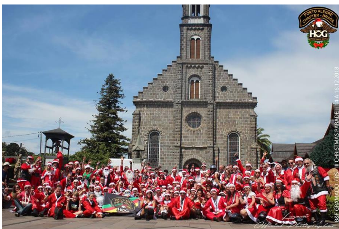
FIGURA 6: “CHRISTMAS PARADE” COM ENCONTRO DE MEMBROS DO HOGS DO RIO GRANDE DO SUL E SANTA CATARINA