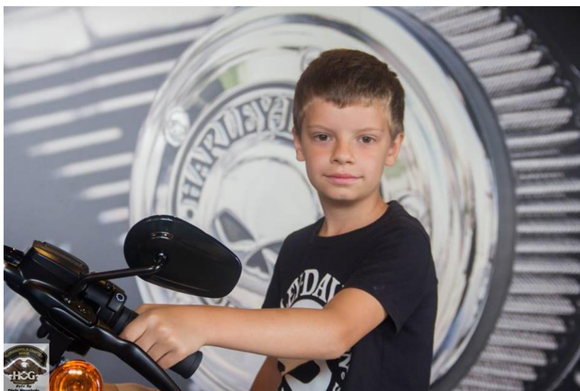
FIGURA 14: IDENTIFICAÇÃO DE FAMILIARES COM O HOG