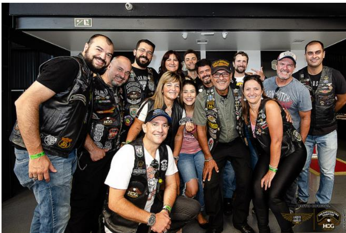
FIGURA 11: TRIBO URBANA DO HOG

Os discursos enunciados no HOG e disseminados pelos entrevistados que pertencem a essa tribo urbana, transformam as suas vidas dentro e fora do grupo, fortalecendo o nível de comprometimento diário, melhorando a condição de saúde e tornando os indivíduos que compõem esse grupo em corresponsáveis pela manutenção da identidade grupal. Ilustramos essa transferência de responsabilidade sobre a imagem grupal por meio dessa foto (Figura 11), na qual estão presentes membros da diretoria atual do HOG do Paraná.