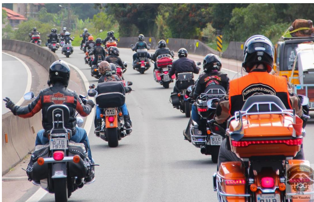
FIGURA 12: BONDE DO HOG