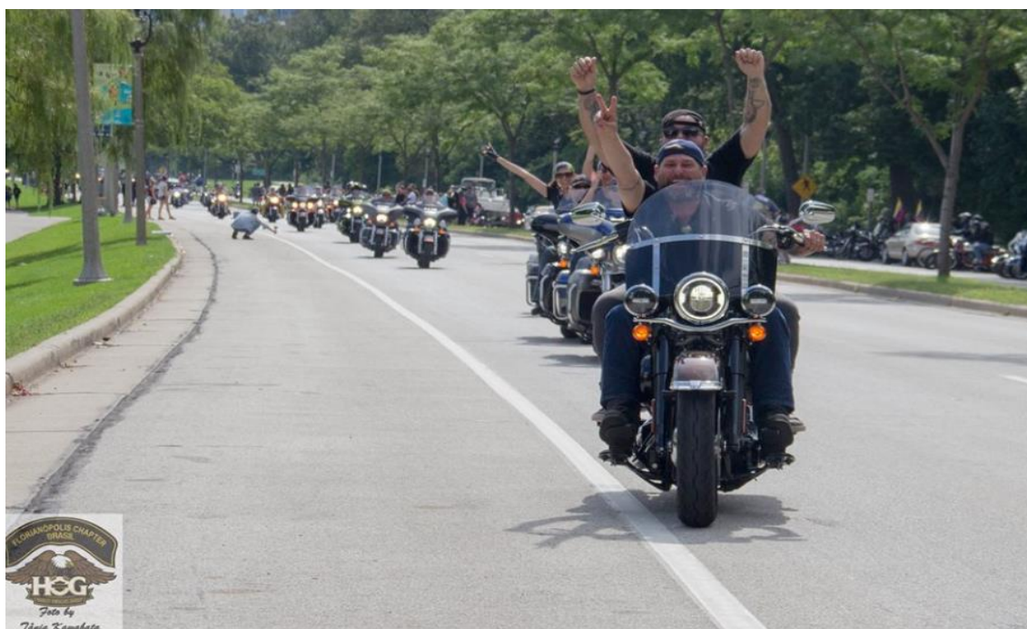
FIGURA 3: COMEMORAÇÃO DOS 115 ANOS DA HARLEY-DAVIDSON REALIZADA NOS ESTADOS UNIDOS