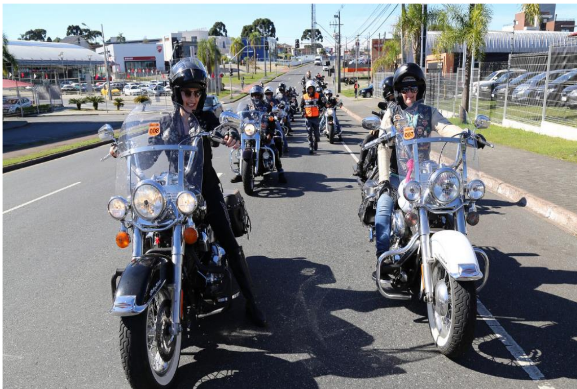
FIGURA 8: PASSEIO DE PRIMAVERA DO HOG