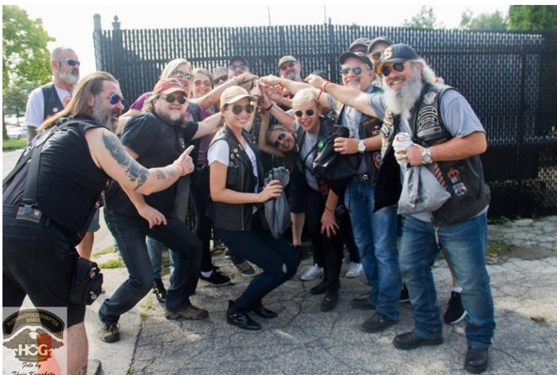
FIGURA 7: GESTOS DE AMIZADE ENTRE OS MEMBROS DO HOG DE SANTA CATARINA E DO RIO GRANDE DO SUL