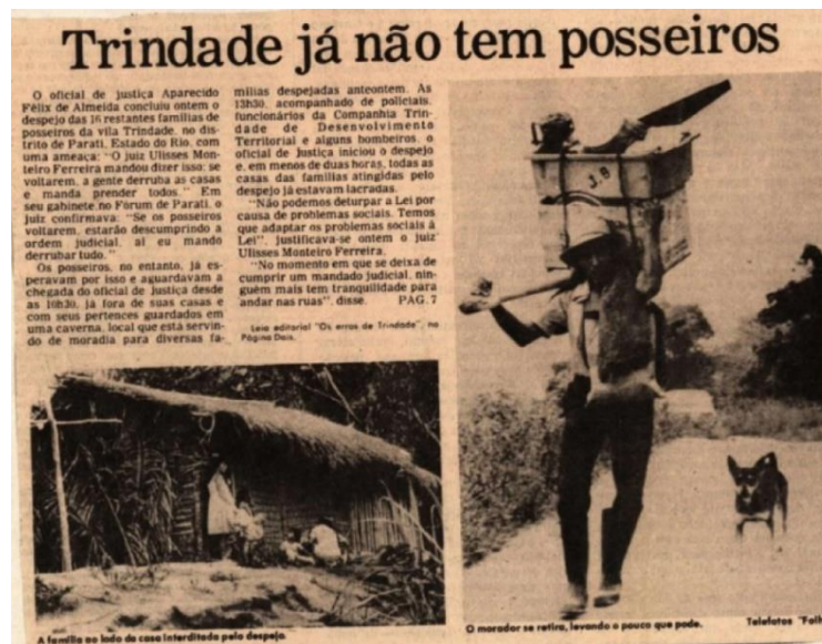
Figura 10 - Caiçara carregando seus pertences após despejo