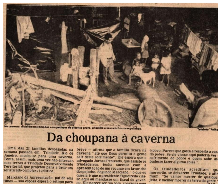
Figura 11 - Família de caiçaras morando em caverna após despejo

Ainda assim, a maioria das famílias despejadas não deixou Trindade. Algumas foram se abrigar em cavernas, outras passaram a morar em ranchos de pesca na areia da praia e outras levaram seus pertences para a beira da estrada. Além disso, segundo o depoimento de Ricci Martinelli no documentário Trindadeiros (2009), assim que uma família era despejada, eles se uniam e construíam uma casa próxima ao local. Essa situação dramática ganhou ênfase na imprensa, sendo veiculada até no Jornal Nacional .