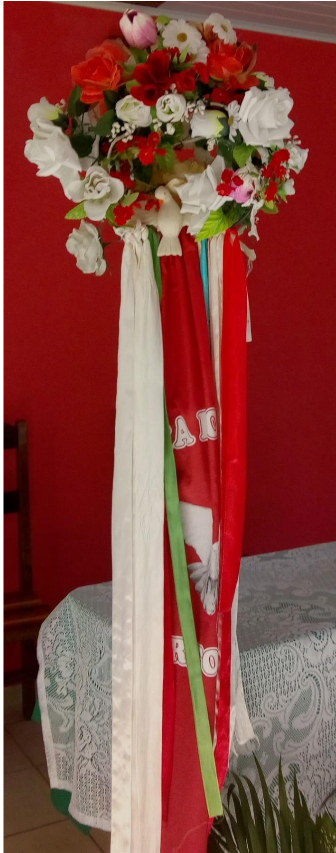
Figura 2 - Bandeira do divino feita por Antônia