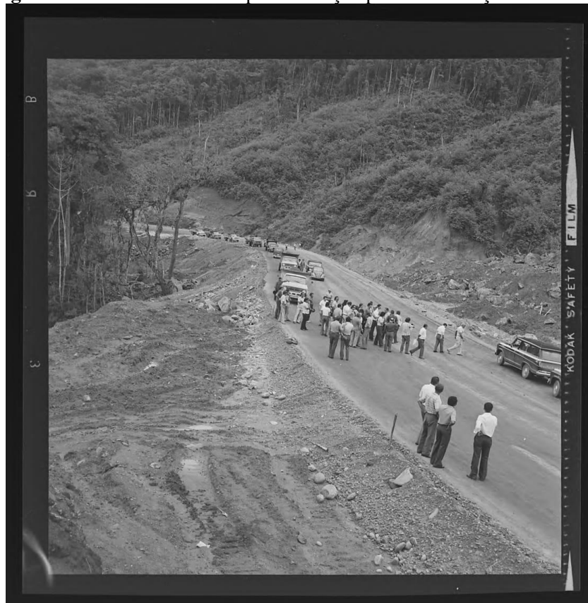
Figura 5 - Trecho em fase de pavimentação para a construção da rodovia.