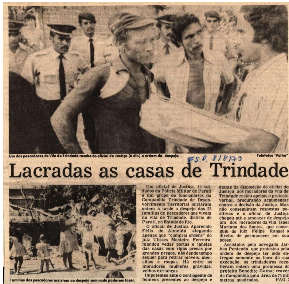
Figura 9 - Trindadeiros encarando o oficial de justiça no dia do despejo