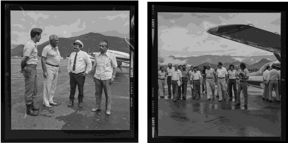
Figura 3 e Figura 4 - Mário Andreazza no aeroporto de Ubatuba, em visita às obras da Rio-Santos.