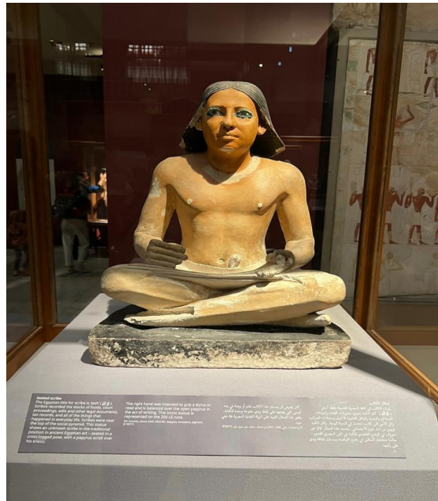
Figura 1. Escriba sentado